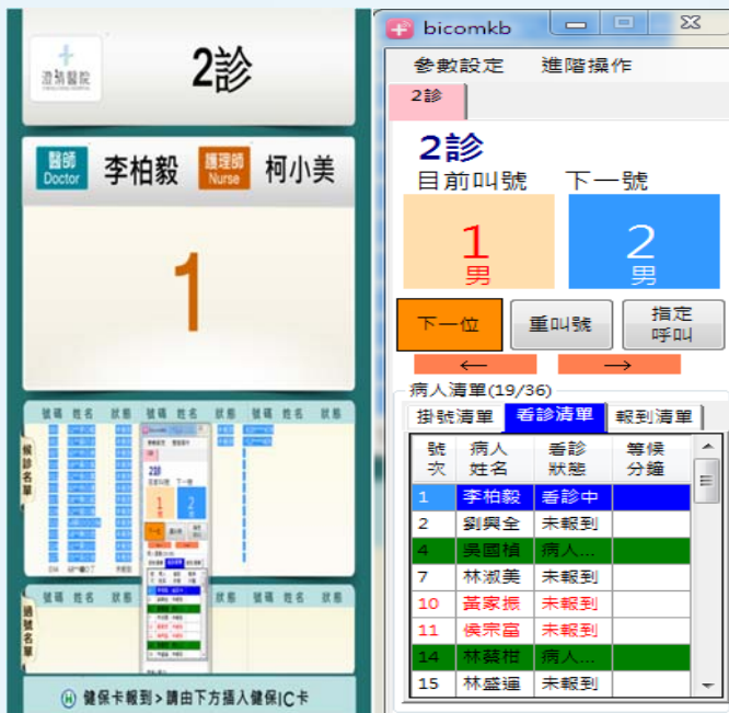
(圖一左) 澄清醫院診間版型畫面，可供病患察看候診名單及即時叫號訊息。